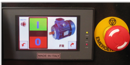
Avvio pompa e pulsante emergenza Pump starter and emergency button