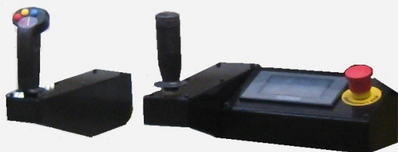
Pulsantiera di controllo Control panel with pushbuttons