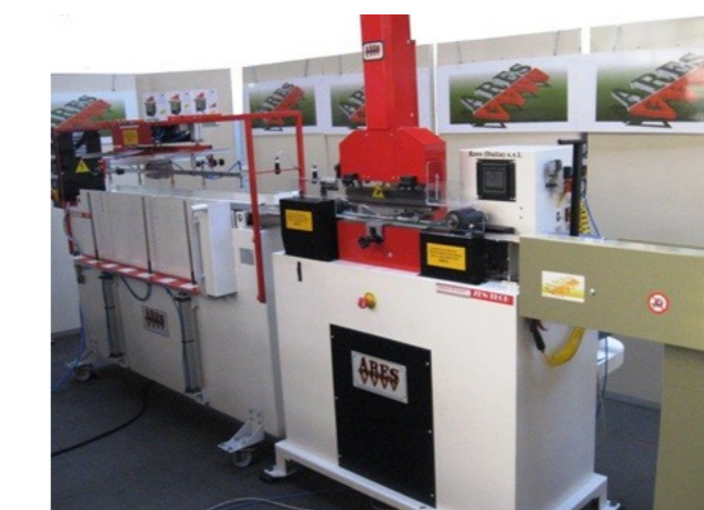
ZEN TECH + Caricatore/Scaricatore BAT ZEN TECH + Loader/Unloader BAT

ZEN TECH is suitable for leather goods working lines horizontal and vertical